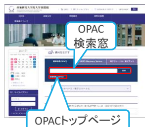
図書館ウェブサイト