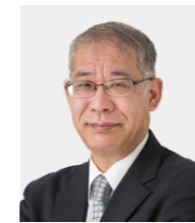
廣木 謙三 教授