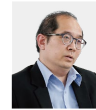
インタラクムナード・パトラポン 教授、副ディレクター