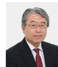
上山 隆大 客員教授(内閣府総合科学技術・ イノベーション会議 有識者議員)

専門分野 科学技術政策、科学技術史、公共政策、 イノベーション政策、アメリカ研究、 高等教育論