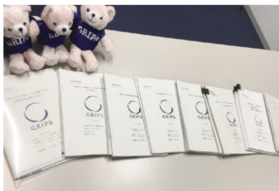
充実したポリシー・ペーパーの作成

よって、自治体で医療政策に携わる人材には、政策の体系的な理解に加え、最新の動向を把握しつつ課題の本質を見極め、ステークホルダーと議論を重ねて共通の理解を形成した上で、的確な政策を展開する能力が求められます。またそうした人材には、医療・保健・介護に限らず、福祉・住宅・雇用・まちづくりといった関連施策を視野に入れた、総合的な施策の形成能力も必要となります。医療政策コースでは、以下のような学びの機会と懇切丁寧な指導を通じ、医療政策のプロフェッショナルを養成しています。