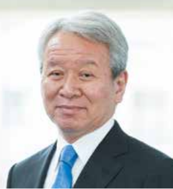
政策研究大学院大学長

このような時代にあって、地域政策コースでは、将来の自治体幹部として、国内外にわたる幅広い視野を持ち、2040年問題とも言えるこれら諸課題に対処できる政策構想力と行政経営能力を有する人材を養成するため、その教育をさらに充実・発展させていきたいと考えています。