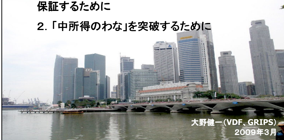
大野健一 (VDF, GRIPS) 2009年3月